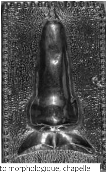
Ex-voto morphologique, chapelle Notre-Dame des dunes, Dunkerque

une jouissance à la manipulation ... Une intransigeance qui ne serait que le faux-nez d'une certaine lâcheté ?